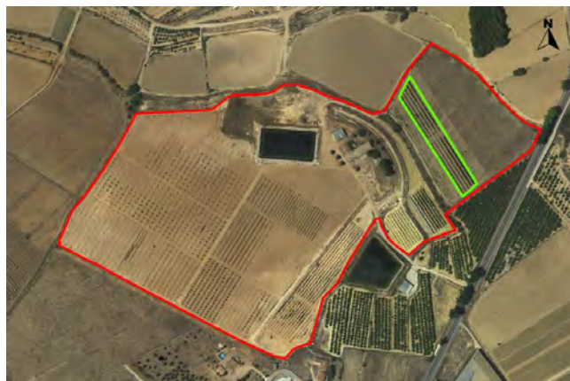
Ubicación melocotoneros en las Nogueras