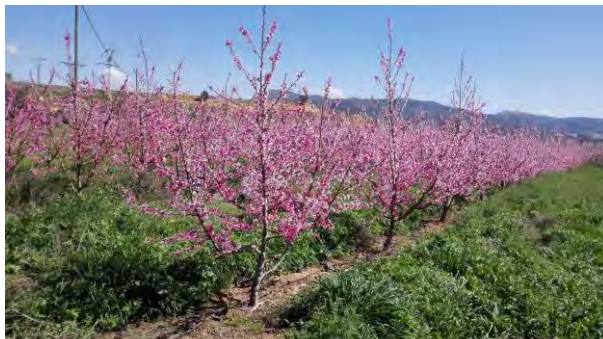
Melocotoneros en floración con formación eje central 5 x 3 m, finca Las Nogueras, imagen tomada el 16 de marzo de 2017.

La fruticultura de melocotón en la Región de Murcia es una región referente en cuanto a calidades y producciones, existiendo un sector viverista productor de planta muy dinámico en cuanto a la obtención de nuevas variedades.