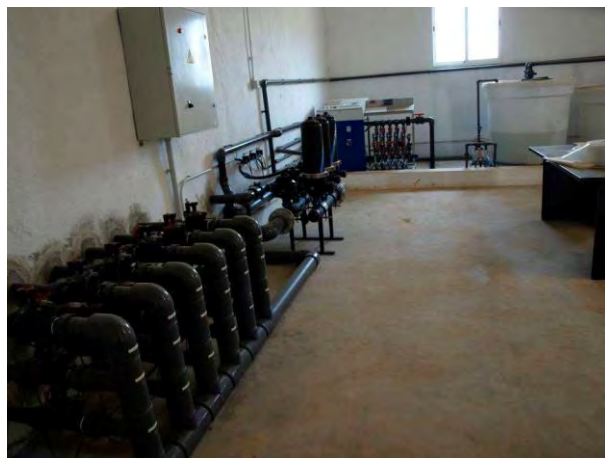
Cabezal de riego.