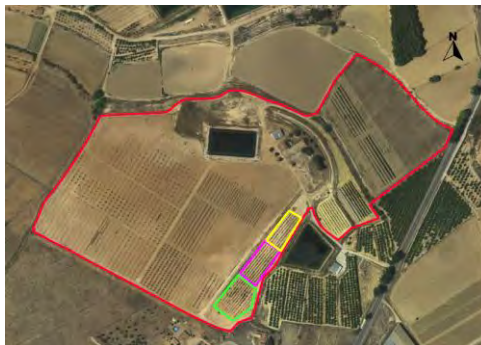
Ubicación de los cerezos.