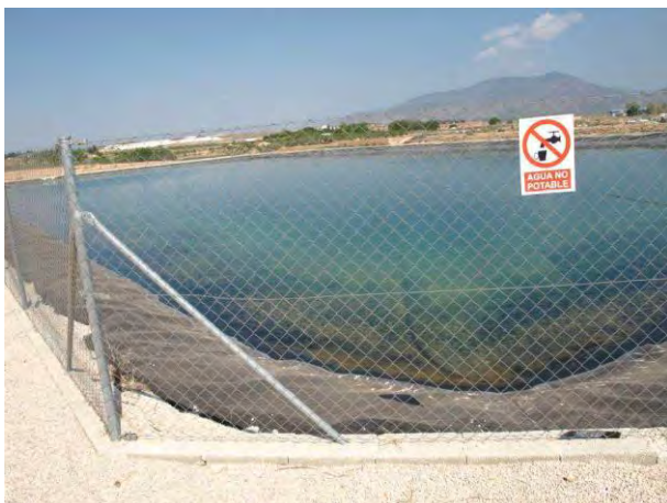
Embalse de riego.