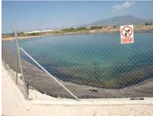
Embalse de riego Las Nogueras.