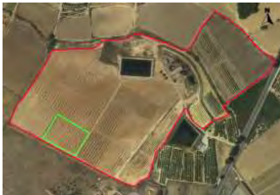
Croquis de ubicación de la parcela pistachos en el CDA La Nogueras.

Se trata de una pequeña parcela con coordenadas UTM-Huso 30 (ETRS-89) ubicada en la finca denominada Las Nogueras de Arriba, propiedad de la Comunidad Autónoma de la Región de Murcia, situada catastralmente en la parcela 385 del polígono 129 en el paraje Los Prados, Caravaca de la Cruz, según el croquis de ortofoto: