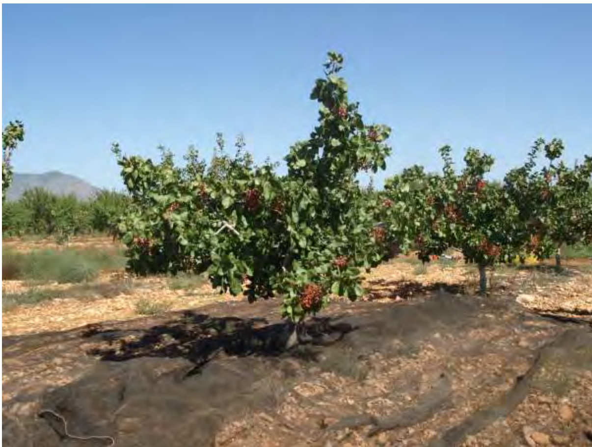
Recolección de la variedad Sirora, Jornada Técnica del Pistacho en la parcela demostrativa en CDA "Las Nogueras" (2019).