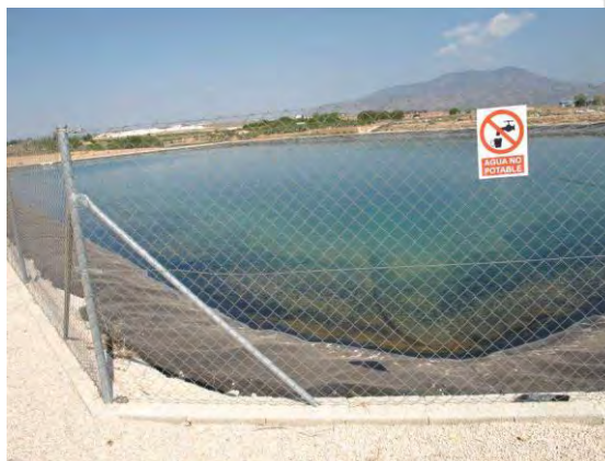
Embalse de riego CDA Las Nogueras