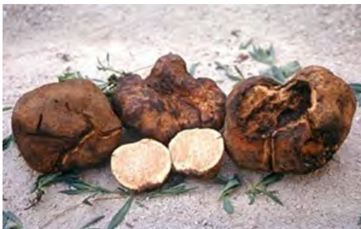
Figura 1. Trufa del desierto ( Terfezia claveryi )

Terfezia claveryi es una especie primaveral que crece en terrenos básicos, asociada a las raíces de Helianthemum spp., que se distribuye por la zona este de la Península Ibérica. Tiene un tamaño de 3-12 cm, de forma irregular y con numerosos pliegues por crecer en terrenos más compactos. Se ven frecuentemente ejemplares aplanados y lobulados. Muchos son piriformes con una base acabada en punta. Peridio grueso de color marrón rojizo oscuro al madurar. Gleba inicialmente blanquecina y luego rosa asalmonada con venas pálidas. Pero que a veces se manchan de pardo amarillento en contacto con el aire. Microscópicamente presenta ascos globosos a ovoideos, con 8 esporas amarillo ocre, esféricas, de 18-21 \mu\text{m} (incluida la ornamentación), decoradas con unas verrugas hemisféricas de hasta 2 \mu\text{m} de alto y 2-3 \mu\text{m} de ancho, que forman un retículo muy bien desarrollado y que es más evidente cuando las verrugas son más bajas. Peridio hifal.