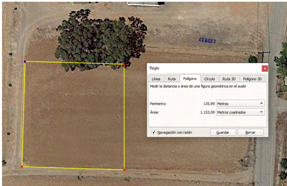
Figura 5. Zona utilizada para el cultivo, con una superficie aproximada de 1150 m 2.

La superficie ocupada por el cultivo es de aproximadamente 1155 m 2 (33x35m, 33 m de largo de líneas de cultivo y 35m de ancho de la plantación) (figura 5).