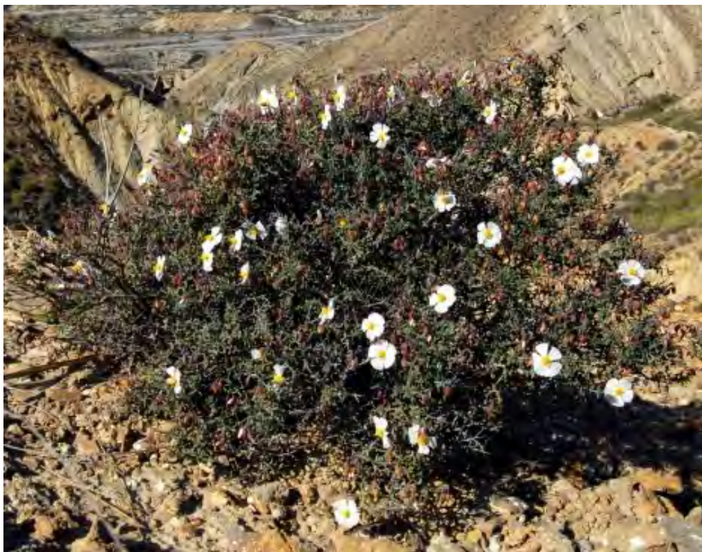
Figura 2. Planta de Helianthemum almeriense , huésped de Terfezia.

Es un cultivo que se adapta bien al riego deficitario, sólo requiriendo riegos de plantación y riegos de apoyo durante el cultivo, en los meses de agosto a noviembre anterior al año de fructificación, el cual empieza a los 12-18 meses de su plantación.