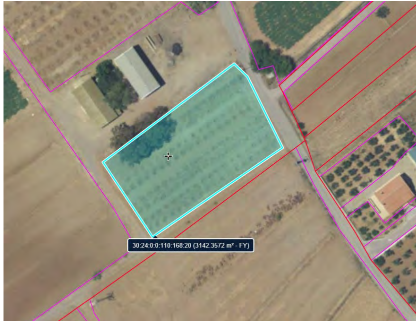
Figura 4. Recinto SIGPAC 20, parcela 168, polígono 110.

La superficie ocupada por el cultivo es de aproximadamente 1155 m 2 (33x35m, 33 m de largo de líneas de cultivo y 35m de ancho de la plantación) (figura 5).