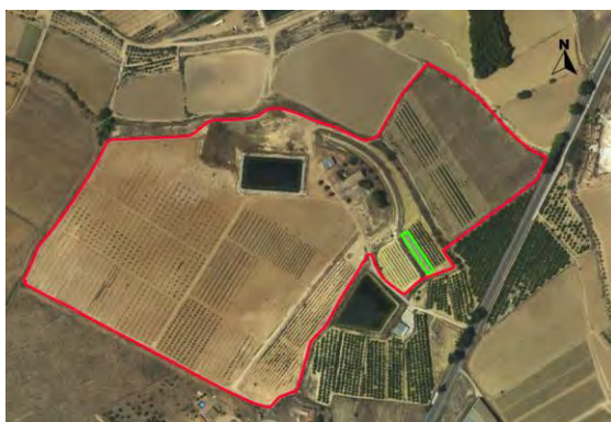
Croquis ubicación del cultivo del kiwi CDA Las Nogueras.

El proyecto se desarrolla en la Finca Experimental de “las Nogueras”, en el término municipal de Caravaca de la Cruz, catastralmente en parte de la parcela 385 del polígono 129, ubicado al lado de la parcela de manzano, según el croquis de ortofoto siguiente: