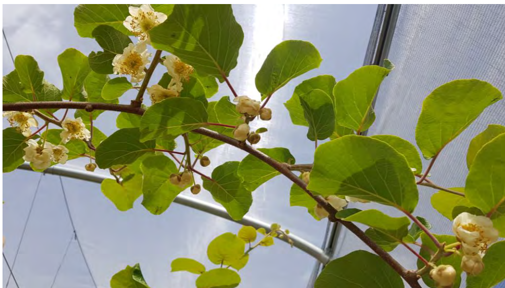
Detalle de la flor masculina de Tomuri en el CDA Las Nogueras en 2020.

El resto de variedades de kiwi alcanza la floración plena en fechas muy próximas y coincidentes con el macho Tomuri. Sin embargo, la variedad amarilla Doris no se poliniza bien y su productividad es nula por falta de un macho coincidente.