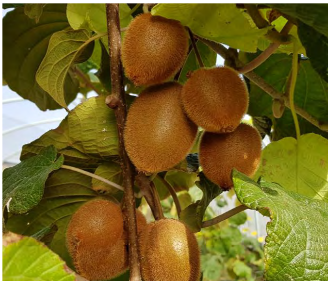
Detalle productivo de Meris en el CDA Las Nogueras

Para cada variedad se determinarán los parámetros de producción (kg/pl y kg/ha), calidad de cosecha: características organolépticas, calibre, color, °Brix, etc., cuando se presenta alguna recolectable.