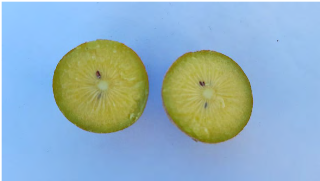
Detalle de frutos de la variedad Doris, con deficiente polinización en el CDA (2020).